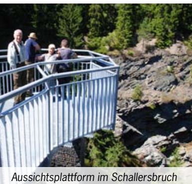
Aussichtsplattform im Schallersbruch