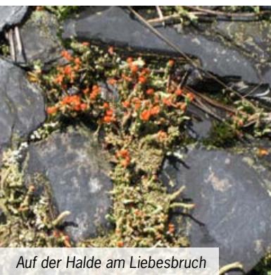
Auf der Halde am Liebesbruch

Mit dem Ausbruch der „Variszischen Gebirgsbildung“ ist die erdgeschichtliche Entwicklung der Region noch längst nicht abgeschlossen. Das entstandene Hochgebirge ist bald wieder eingeebnet und weicht in erdgeschichtlich kurzer Zeit zunächst den Küstensümpfen der beginnenden Perm-Zeit und wenig später dem Zechstein-See. Erst in der Erdneuzeit, im Alttertiär vor etwa 60 Millionen Jahren, beginnt sich das heutige Thüringisch-Fränkische Schiefergebirge wieder spürbar anzuheben. In diese Zeit fällt auch die Entstehung vieler Erzvorkommen. Sie bilden sich an den Zerbrehungen, die mit den Hebungsprozessen einhergehen. Erst vor etwa 2 Millionen Jahren führt schließlich eine letzte Anhebung zur Entstehung des heutigen Mittelgebirges.