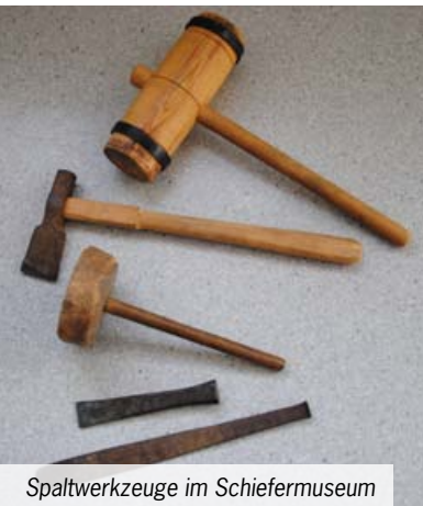
Spaltwerkzeuge im Schiefermuseum